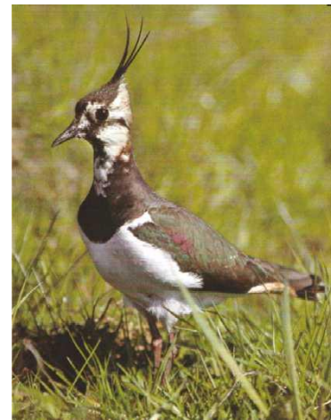
TABEL: waarnemingen broedsels Kievit rondom Steenderen